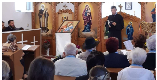
Preasfântă Inimă al lui Isus și a fost reînnoit angajamentul membrilor Reuniunii Mariane Beiuș.